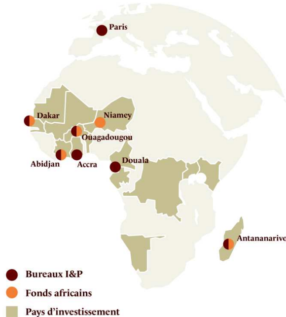
L'implantation des équipes et investissements d'I&P